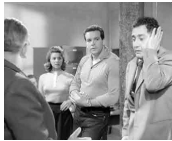
1955 UN HÉROS DE NOTRE TEMPS (Un eroe dei nostri tempi) de M. Monicelli avec G. Ralli, Alberto Sordi