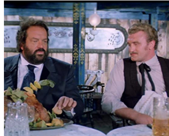
1981 ON M'APPELLE MALABAR (Occhio alla penna) de Michele Lupo avec Joe Bugner