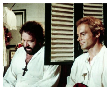
1974 LES DEUX MISSIONNAIRES (Porgi l'altra guancia) de Franco Rossi avec Terence Hill