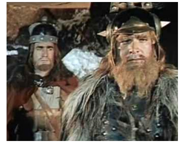
1959 HANNIBAL (Annibale) d'Edgar G. Ulmer et Carlo Ludovico Bragaglia