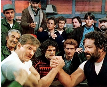
1978 MON NOM EST BULLDOZER (Lo chiamavano Bulldozer) de M. Lupo avec R. Harmstorff