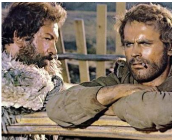
1969 LA COLLINE DES BOTTES (La collina degli stivali) de Giuseppe Colizzi avec Terence Hill