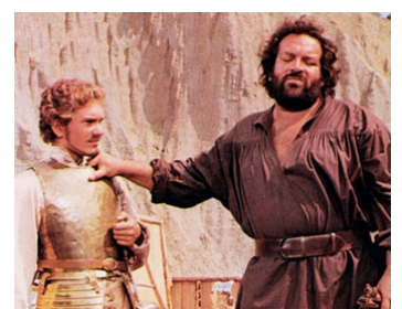
1975 LA GRANDE BAGARRE (Il Soldato di ventura) de P. Festa Campanile avec A. Infanti