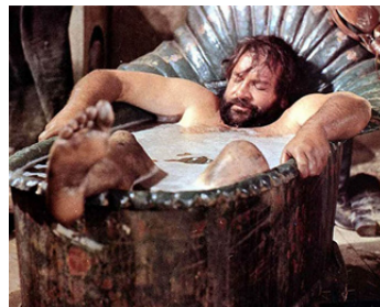
1971 ON CONTINUE À L'APPELER TRINITA (Continuavano a chiamarlo Trinità) d'E. Barboni