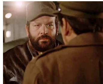
1969 À L'AUBE DU CINQUIÈME JOUR (Dio è con noi) de Giuliano Montaldo