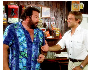
1978 PAIR ET IMPAIR (Pari e dispari) de Sergio Corbucci avec Terence Hill