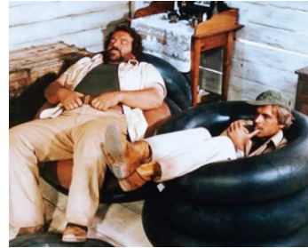
1979 CUL ET CHEMISE (Io sto con gli ippopotami) d'Italo Zingarelli avec T. Hill