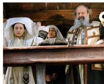
2003 EN CHANTANT DERRIÈRE LES PARAVENTS (Cantando dietro...) d'E. Olmi avec J. Ichikawa