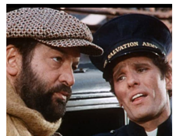
1972 LES ANGES MANGENT AUSSI DES FAYOTS d'Enzo Barboni avec Giuliano Gemma