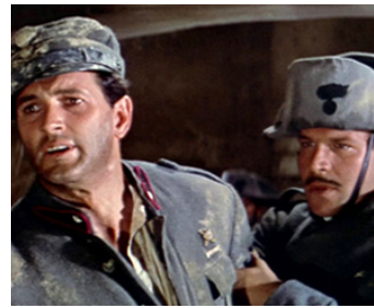
1957 L'ADIEU AUX ARMES (A Farewell to Arms) de Charles Vidor avec Rock Hudson