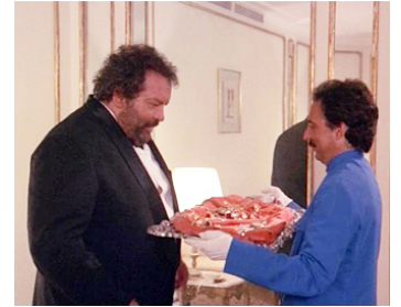
1984 ATTENTION LES DÉGÂTS (Non c'è due senza quattro) d'Enzo Barboni