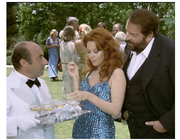
1978 PIED-PLAT EN AFRIQUE (Piedone l'africano) de Steno avec Dagmar Lassander