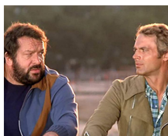
1974 ATTENTION, ON VA S'FÂCHER (Altrimenti ci arrabiamo!) de M. Fondato avec Terence Hill