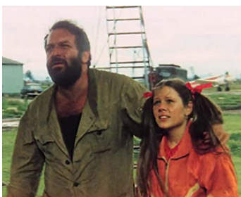
1972 MAINTENANT, ON L'APPELLE PLATA (Più forte ragazzi!) de Giuseppe Colizzi