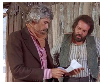
1972 LA HORDE DES SALOPARDS (Una ragione per vivere...) de T. Valerii avec James Coburn