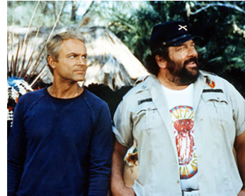
1981 SALUT L'AMI, ADIEU LE TRÉSOR de Sergio Corbucci avec Terence Hill