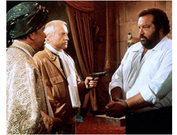
1980 PIED-PLAT SUR LE NIL (Piedone d'Egitto) de Steno avec Karl Otto Alberty