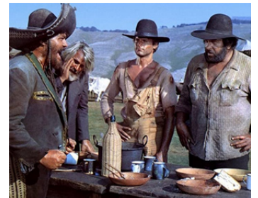
1970 ON L'APPELLE TRINITA (Lo chiamavano Trinità) d'E. Barboni avec R. Capitani, T. Hill