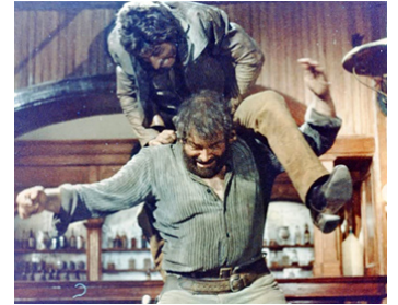
1969 LES QUATRE DE L'AVE MARIA (I quattro dell'Ave Maria) de Giuseppe Colizzi