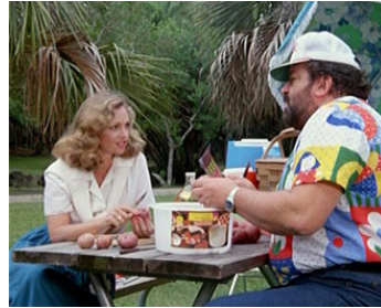
1982 ESCROC, MACHO ET GIGOLO (Cane e gatto) de B. Corbucci avec April Clough