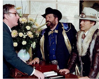
1983 QUAND FAUT Y ALLER, FAUT Y ALLER (Nati con la camicia) d'E. Barboni avec T. Hill