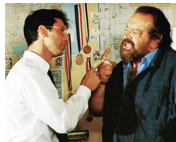
1990 ANGE OU DÉMON (Un Piede in Paradiso) d'Enzo Barboni avec Thierry Lhermitte