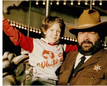
1979 LE SHÉRIF ET LES EXTRA-TERRESTRES de Michele Lupo avec Cary Guffey