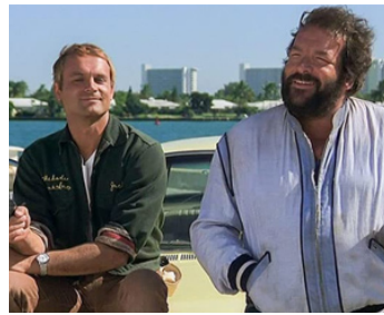
1977 DEUX SUPER-FLICS (I due superpiedi quasi piatti) d'Enzo Barboni avec Terence Hill