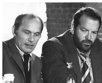
1972 LA VENGEANCE DU SICILIEN (Torino nera) de Carlo Lizzani avec Marcel Bozzuffi