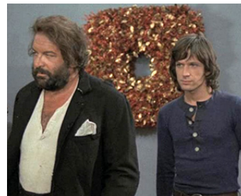
1971 4 MOUCHES DE VELOURS GRIS (4 Mosche di velluto grigio) de D. Argento avec M. Brandon