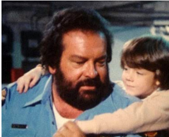
1980 FAUT PASS POUSSER (Chissà perché...) de Michele Lupo avec Gary Guffey