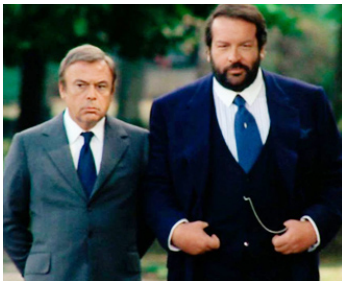
1977 L'EMBROUILLE (Charleston) de Marcello Fondato avec Herbert Lom