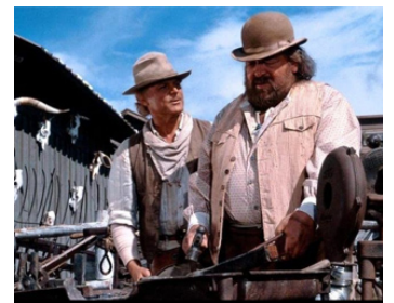
1994 PETIT PAPA BASTON (Botte di Natale) de Terence Hill avec Terence Hill