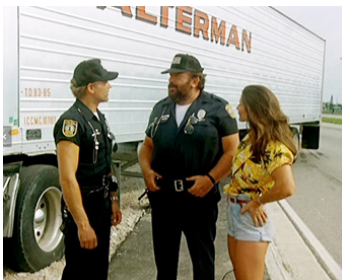
1985 LES SUPER-FLICS DE MIAMI (Miami Supercops) de B. Corbucci avec Terence Hill, Rhonda Lundstead