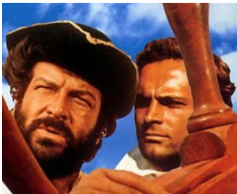
1971 LE CORSAIRE NOIR (Il Corsaro nero) de Vincent Thomas avec Terence Hill