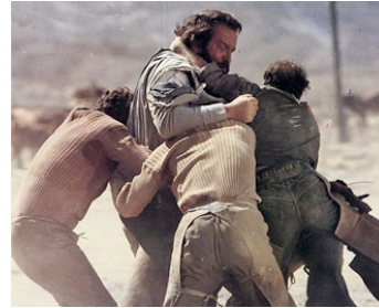
1967 DIEU PARDONNE, MOI PAS! (Dio perdona... io no!) de Giuseppe Colizzi