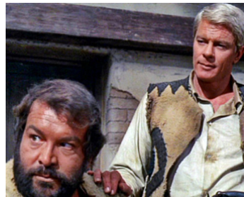
1969 CINQ HOMMES ARMÉS (Un esercito di 5 uomini) de Don Taylor avec Peter Graves