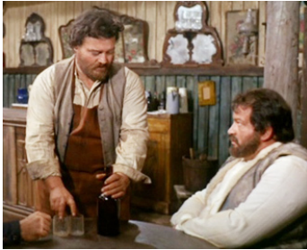
1967 CINQ GÂCHETTES D'OR (Oggi a me... domani a te) de Tonino Cervi