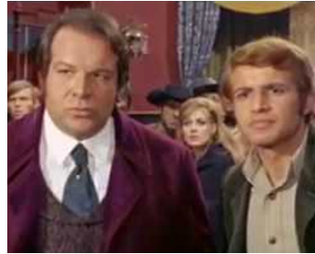
1967 PAS DE PITTÛ POUR LES SALOPARDS (Al di là della legge) de G. Stegani avec Herbert Fux